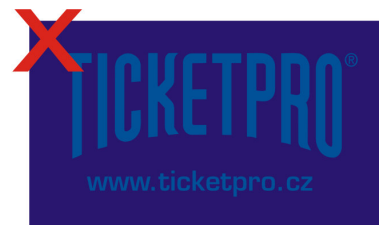
Logo na tmavém pozadí