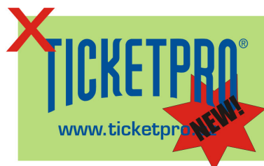
Nedodržení ochranné zóny