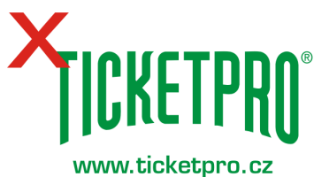
Nesprávné použití barvy