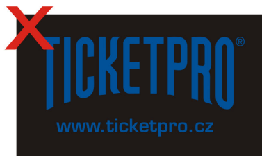
Logo na tmavém pozadí