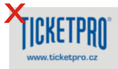
Nevyhovující kvalita loga