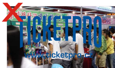
Logo na neklidné ploše